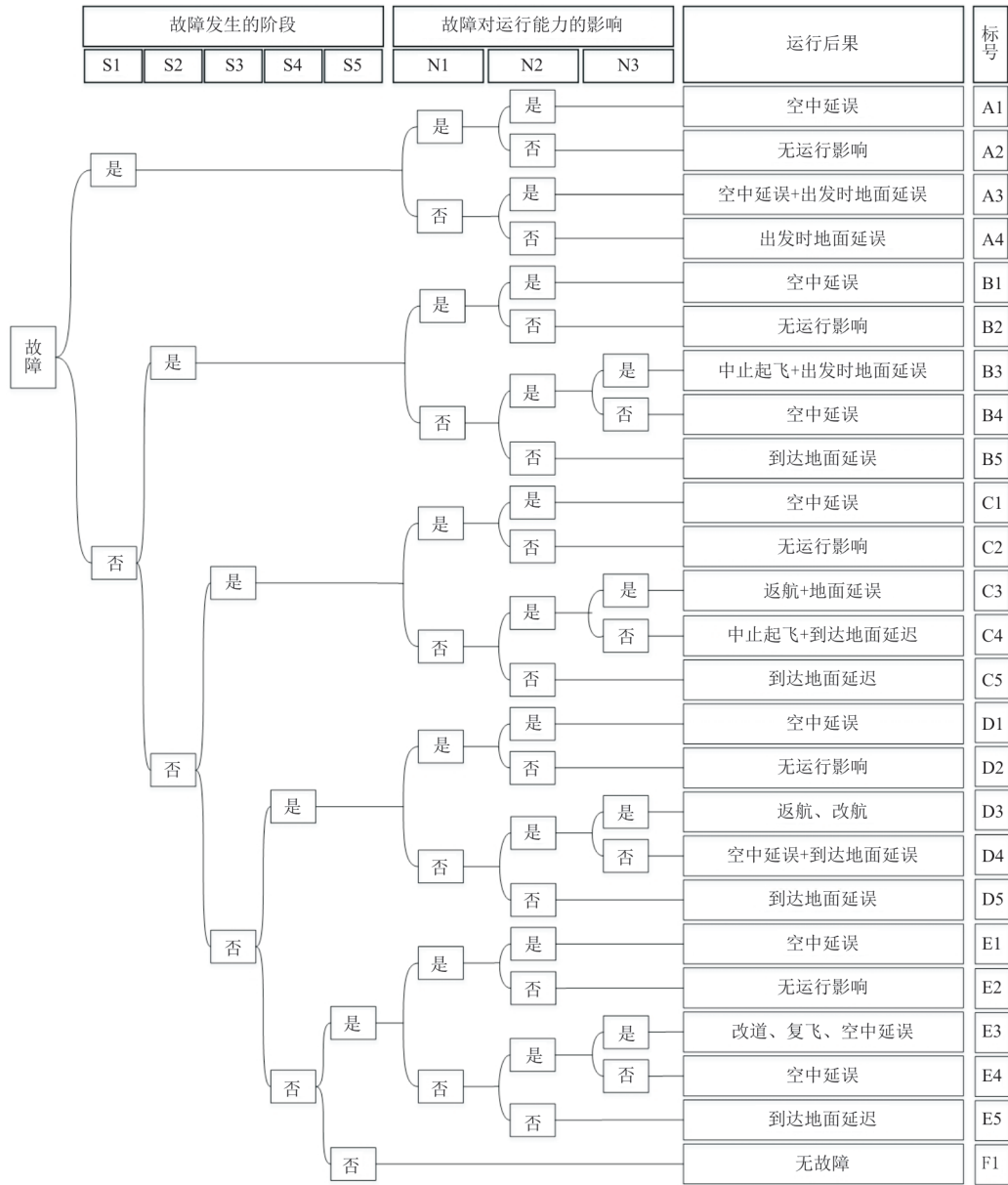
图 3 飞机系统故障可能导致的运行后果的事件树

生故障的运行阶段和故障对运行能力的影响。系统故障可能引起的运行后果如图 3 所示。