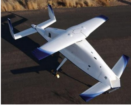
图2 X-50A“蜻蜓”概念验证机 [22] Fig. 2 X-50A "Dragonfly" proof-of-concept [22]