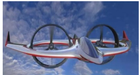
图11 Project Zero倾转涵道式无人机 [35] Fig. 11 Project Zero tilt-duct UAV [35]

倾转涵道式垂直起降固定翼无人机的垂直起降方式与倾转旋翼式相同,不同之处是将旋翼换成了涵道,这种几何特征上的改进使得动力部件可以更好地融入机身/机翼中。Project Zero倾转涵道风扇验证机于2010年开始研制,采用飞翼布局,如图11所示,包括可拆卸机翼和中央翼,其中中央翼面积很大,于两侧各开有一个圆环以安装内埋式涵道风扇,并通过安装罩上装有的转轴按任务需求绕机身横轴进行倾转。