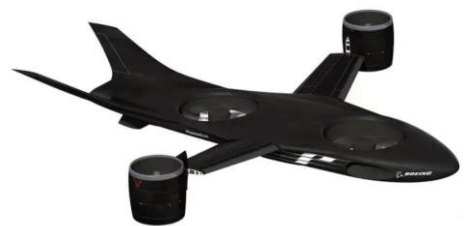
图12 “幽灵雨燕”倾转涵道式无人机概念图 [36-37] Fig. 12 "Ghost Swift" tilt-duct UAV concept [36-37]

美国波音公司鬼怪工厂于2016提出的“幽灵雨燕”倾转涵道式无人机,如图12所示,由四个涵道风扇共同提供动力,垂起状态下由机身内埋涵道提供主要升力,翼梢涵道向上倾转提供辅助升力,前飞状态下机身风扇及其盖板关闭,翼梢涵道向前倾转提供前飞动力。