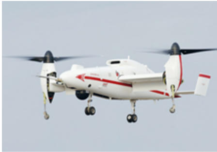
图7 “鹰眼”倾转旋翼式无人机 [30-31] Fig. 7 "Hawk-eye" tilt-rotor UAV [30-31]

人机的总体布局十分相像,都采用中单翼布局,双垂尾内倾,两副旋翼由机身内部的一台发动机驱动,推力转向则是通过翼尖旋翼的倾转来实现。