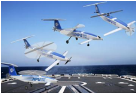
图3 “灵龙”无人机概念图 [24] Fig. 3 "Linglong" UAV concept [24]