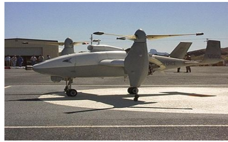
图10 TR-60倾转旋翼式无人机 [34] Fig. 10 TR-60 tilt-rotor UAV [34]