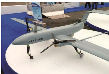
图9 “黑豹”倾转旋翼式无人机 [33] Fig. 9 "Panther" tilt-rotor UAV [33]

此外,采用倾转旋翼式方案的还有以色列2012年研制的“黑豹” [33] 和韩国2017年研制的TR-60 [34] 垂直起降固定翼无人机,如图9~图10所示。