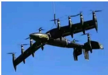
图13 GL-10“闪电”分布式动力倾转机翼验证机 [38]

倾转分布式动力结构垂直起降固定翼无人机与倾转旋翼、倾转涵道的最大区别在于其分布式动力部件与机翼的融合度或一体化程度相对更高,且需要利用位于机身内部的倾转机构操纵机翼/动力融合体的旋转运动来实现推力转向。其外形特征与倾转机翼式垂直起降飞行器相类似,但本质上仍是倾转动力的一种特殊体现。NASA兰利中心于2015年推出了GL-10闪电无人机,如图13所示。采用分布式螺旋桨—固定翼常规布局形式,利用机翼上8个螺旋桨和平尾上2个螺旋桨共同驱动实现垂直起降和前飞,目前已经经过多次验证飞行,证明了分布式电推进技术应用于垂直起降飞机具有十分明显的优势,借助于分布式螺旋桨与机翼的一体化设计,全机功重比有效提升,同时电机在整个转速范围内都有较高的效率,且全机巡航阶段飞行的可靠性明显提升。理论上GL-10无人机综合效率能够达到常规直升机的4倍,但其不足之处在于全电驱动下飞行航时相对较短,预计后期采用油电混合动力后此问题可以得到改善。