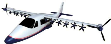
图 16 NASA X-57 分布式电推进验证机 [61] Fig. 16 NASA X-57 distributed electric propulsion verifier [61]