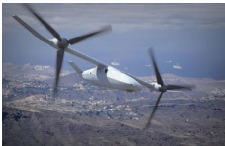
图8 V-247“警惕”倾转旋翼式无人机概念图 [32] Fig. 8 V-247 "Alert" tilt-rotor UAV concept [32]

在继承V-22、“鹰眼”成熟技术的基础上,美国贝尔公司于2019年又提出了V-247“警惕”倾转旋翼无人机方案(如图8所示),其采用的呈纺锤体的机体外形使全机趋于流线型,且将发动机固定安装于机身内,缩小了旋翼短舱截面,有效提高了全机阻力特性 [32] 。同时为进一步提高全机续航性能,V-247“警惕”无人机在旋翼短舱外侧特别增加了一段机翼设计,有效提高了机翼展弦比和升阻比。