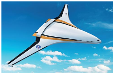
图 17 NASA N3-X 分布式电推进概念图 [61] Fig. 17 NASA N3-X distributed electric propulsion concept [61]

总体来说,分布式电推进技术在飞机总体、气动、动力、控制上已展示出无可比拟的潜力,前文所述如 GL-10“闪电”、XV-24“雷击”垂直起降固定翼无人机等均为分布式电推进技术发展的产物。通过分布式电推进系统与垂直起降固定翼无人机的有效结合,可以获得以下优势:提高巡航效率,增大航时、航程;减小垂直起降和巡航平飞阶段需用功率之间差异,实现动力/气动最优匹配;增强飞行控制能力,提高控制冗余度和鲁棒性。