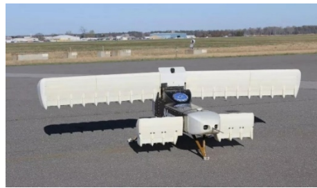
图14 XV-24“雷击”分布式动力倾转机翼验证机 [39-40]

布式动力等设计的可行性。尽管该项目由于在研发高性能1兆瓦级发电机热管理方面遇到技术瓶颈、没有找到合适军方合作伙伴等原因被取消,但XV-24“雷击”无人机所采用的分布式混合电驱动变距涵道风扇、创新的同步电驱动系统、用于垂直起降的可倾转的分布式动力/机翼融合体,具有高效的悬停/平飞双模态适应性等特点,让其被誉为最具革命性的新型未来垂直起降飞机。