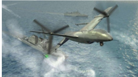
图5 TERN尾座式无人机概念图 [27-28] Fig. 5 TERN tail seat UAV concept [27-28]