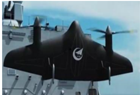
图6 VD-200尾座式无人机 [29] Fig. 6 VD-200 tail seat UAV [29]