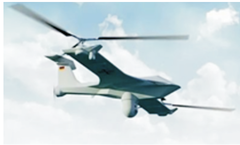
图 1 TU-150 战术多用途无人机 [16] Fig. 1 TU-150 tactical multi-role UAV [16]

在固定翼的基础上加装多旋翼或升力螺旋桨,在垂直起降阶段由多旋翼或螺旋桨系统提供升力,在平飞阶段则切换回固定翼模式。Rheinmetall Airborne Systems 公司与 Swiss UAV 公司于 2016 年联合研制的 TU-150 战术多用途无人机 [16] 应用“双复合”设计,如图 1 所示,即旋翼—固定翼复合和混合动力:两侧翼尖各装配一副三叶旋翼来提供垂直升力,使其在旋翼模式下具有直升飞行能力;而在固定翼模式下,将旋翼停止,靠机翼升力平衡重力,由机身末端电机驱动的推进螺旋桨提供前进推力。TU-150 垂直起降固定翼无人机的设计目标是“具有低保障要求的高性能系统”,其最大起飞质量约为 140 kg,最大任务载荷质量约为 25 kg,可配装多种传感器,能够执行多种任务,最大飞行速度约 222 km/h,续航时间约 8 h。其他如 Songbird 无人机 [17] ,CW 大鹏系列无人机 [18] 等也是采用类似方案。